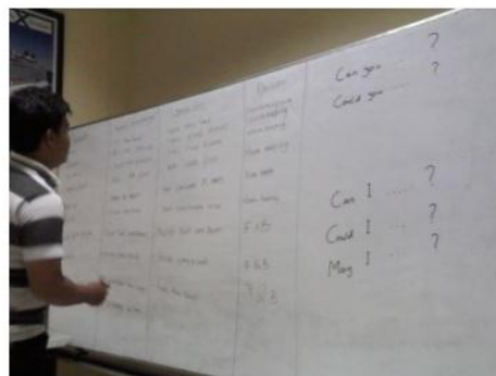
Picture 2. The Staff fills the table by himself